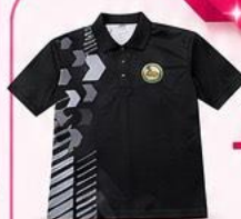
เสื้อโปโล สีดำอปท