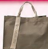
กระเป๋าเอกสาร